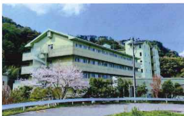
ケアハウス南紀 TEL0739-45-3500 FAX0739-45-3601

●入居一時金を契約時に納入して頂くこととなりますが、預金とは異なり利息はつきません。退所される場合は、一定の率を持ってお返し致します。*詳しくはお気軽にお問い合わせください。