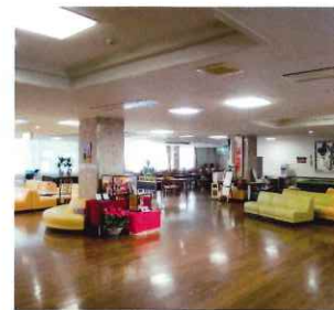
広々ホール（ケアハウス南紀）