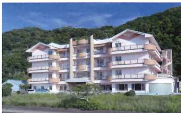
第2ケアハウス南紀 TEL0739-45-3200 FAX0739-45-3040