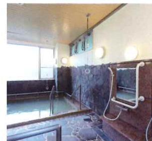
浴室（第2ケアハウス）